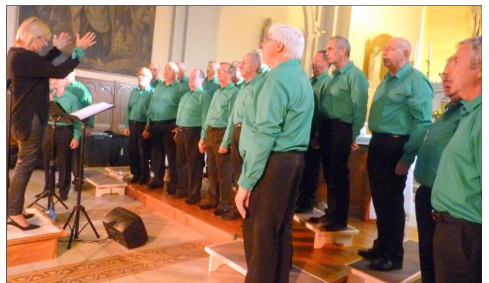
Le programme "Des hommes et des voix" et leur envie de faire partager la passion du chant ont conquis le public.