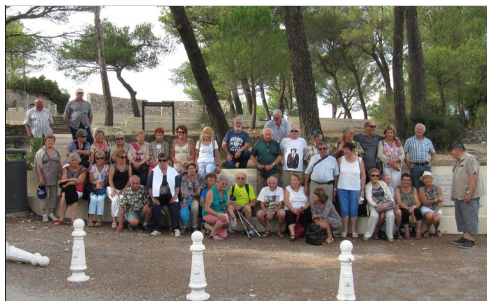
Les AFN ont pris du plaisir à visiter ce beau coin de France.