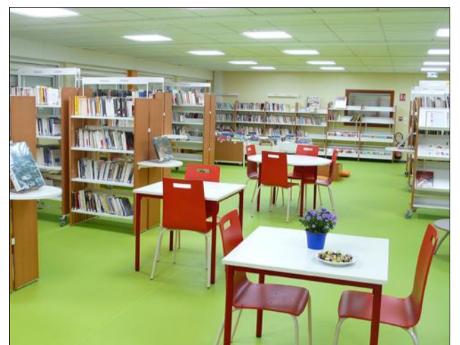
Les locaux aux dispositions harmonieuses et accueillantes de la nouvelle médiathèque.