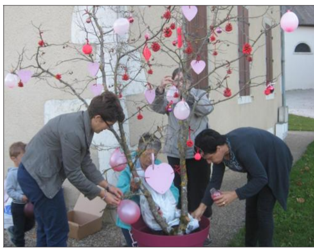
Un joli arbre rose a donc été monté devant la mairie ; des brochures sur le dépistage sont à votre disposition en mairie.

Infos : www.e-cancer.fr , www.cancerdusein-depistage.org .